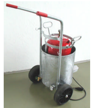
Abbildung A Gasflaschen-Anwärmgerät